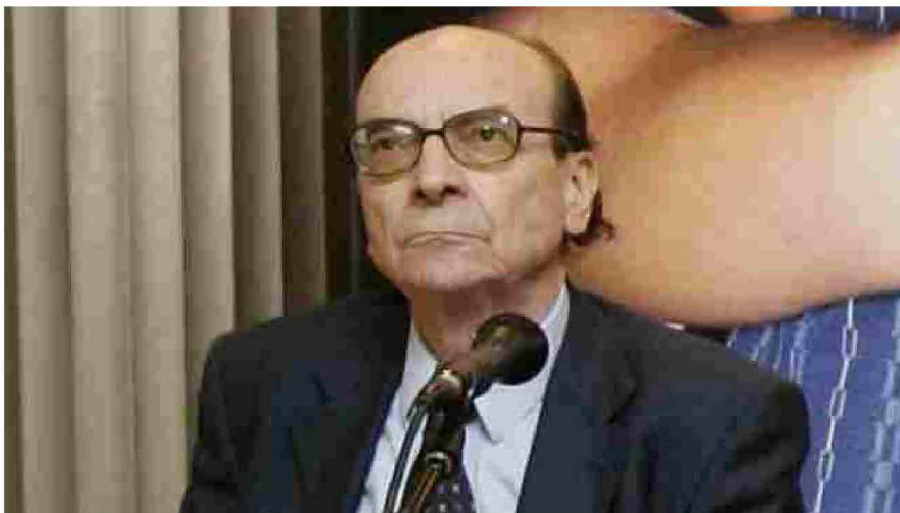
Il filosofo Tullio Gregory

Roma, 3 marzo 2019 - Il filosofo Tullio Gregory è morto ieri a Roma, dov'era nato 90 anni fa. Laureatosi alla 'Sapienza' nel 1950, è stato nella stessa università professore ordinario come titolare, dal 1962, della cattedra di Storia della filosofia medievale e, dal 1967, di quella di Storia della filosofia, oltre che come direttore del Dipartimento di Ricerche storico-filosofiche e pedagogiche.